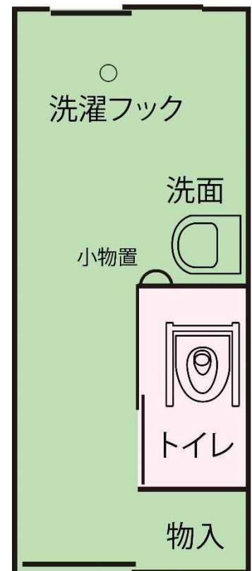
【お部屋の見取り図】