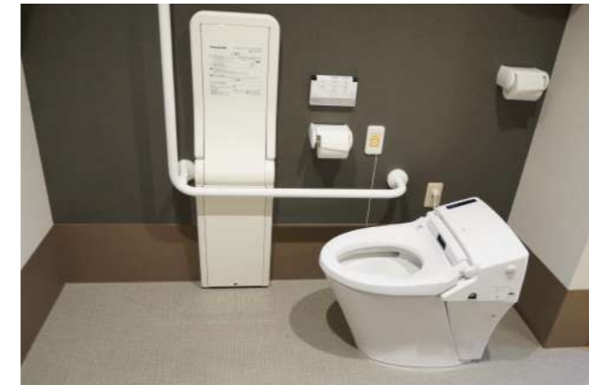
双方に負担のない、優しい設備です。