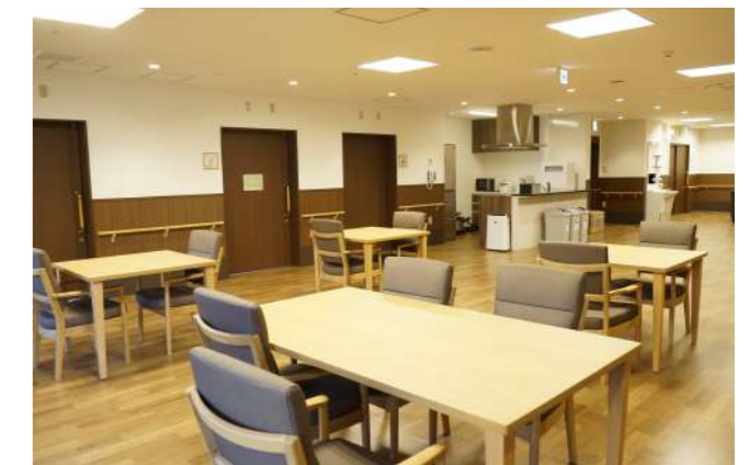
広い廊下・広い空間は心に余裕も与えてくれます