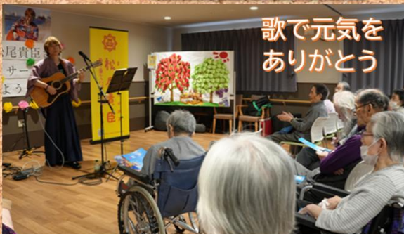
歌で元気を ありがとう

オサーバ山では紅葉🍁が見ごろになっております。酒器🍷もあります（撮影用なので中身は💧）