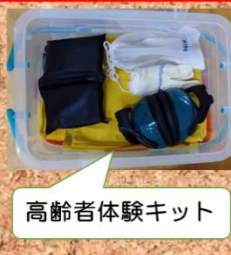
高齢者体験キット