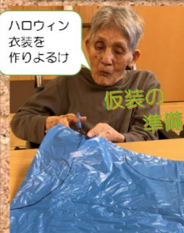
ハロウィン 衣装を 作りよるけ