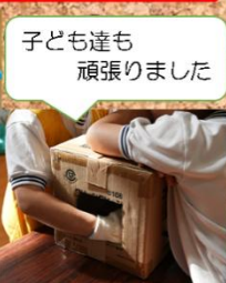
子ども達も 頑張りました