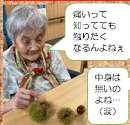
痛いって 知ってても 触りたく なるんよねえ

オサーバ山では紅葉🍁が見ごろになっております。酒器🍷もあります（撮影用なので中身は💧）