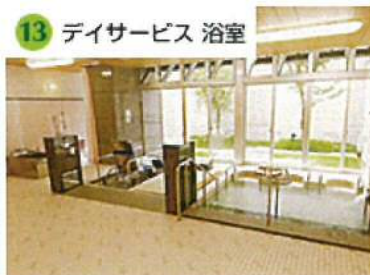
13 デイサービス 浴室